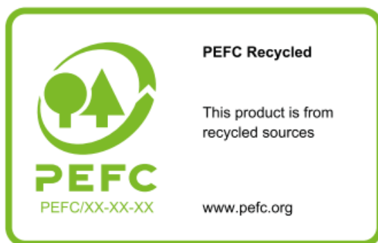
Bảng 2: Tổng quan về các lựa chọn sử dụng nhãn hiệu PEFC trên sản phẩm (on-product)